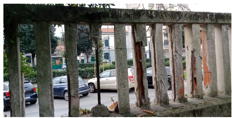
Recinzioni lato sud-via Zola