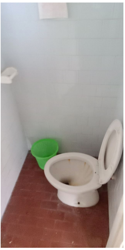
Bagni finiture interne