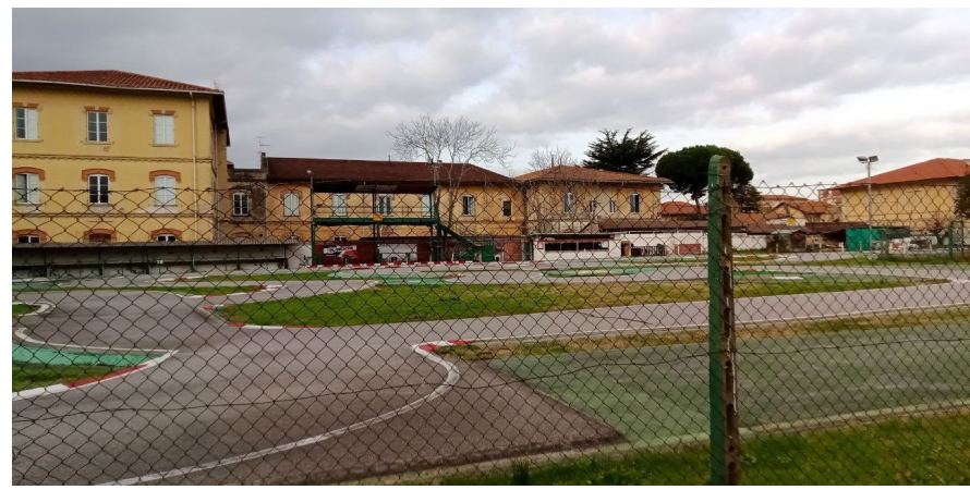
Vista delle piste