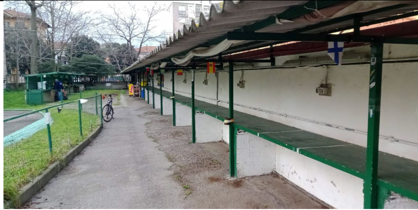
Ripiani manutenzione meccanica mezzi