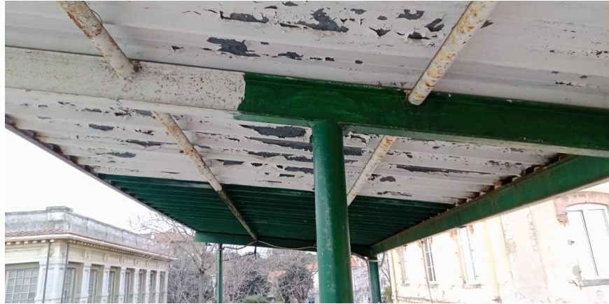
Tettoia in lamiera del palco