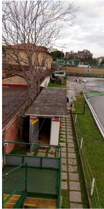
Vista locali accessori